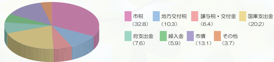
令和2年度一般会計歳出【目的別】予算構成比